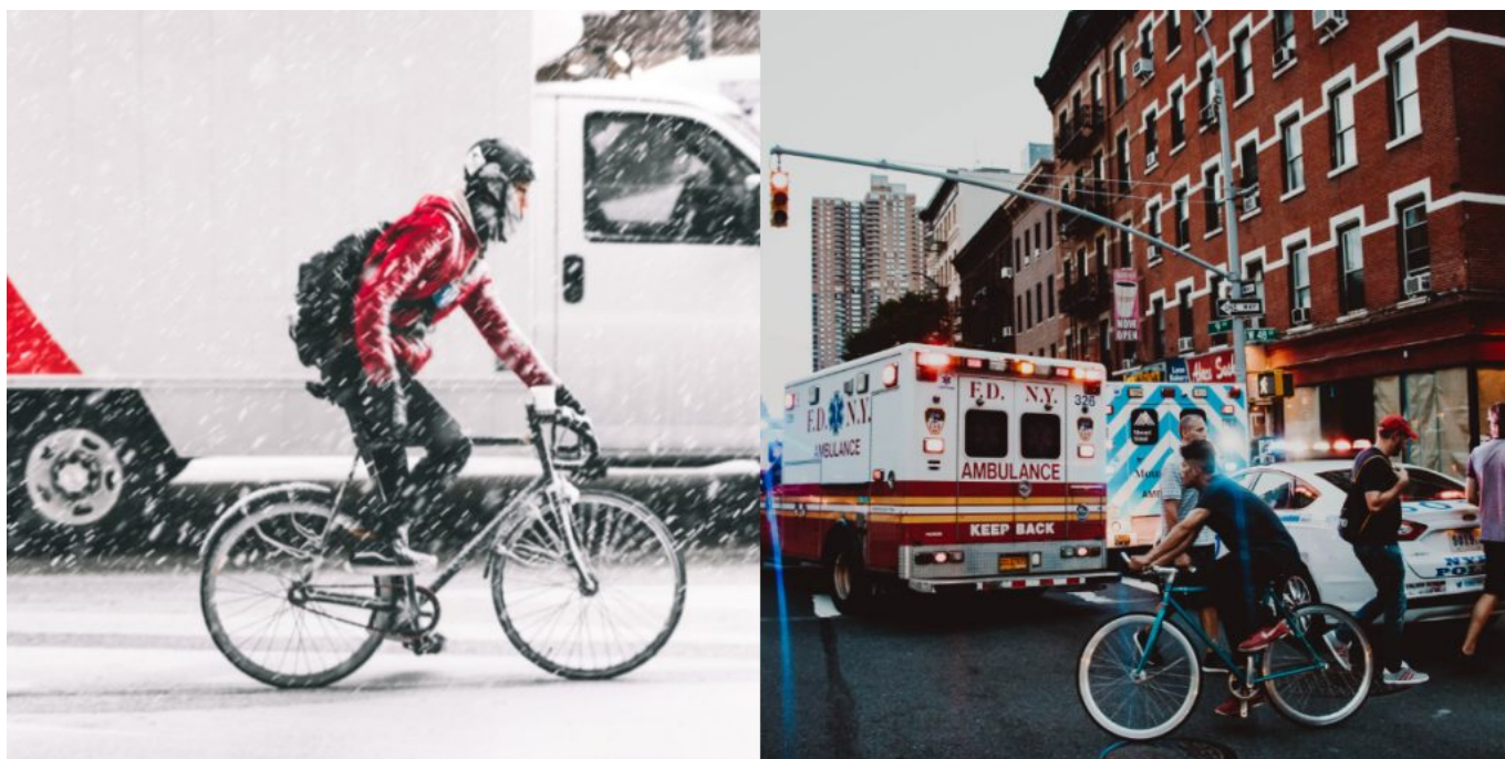
Una nuova bici farebbe la differenza?

Ribadisco un ultimo punto: la sua bici, seppure non all'ultimo grido, funzionava a meraviglia, eppure sostituirla è stata la prima ed unica cosa che gli è venuta in mente di fare.